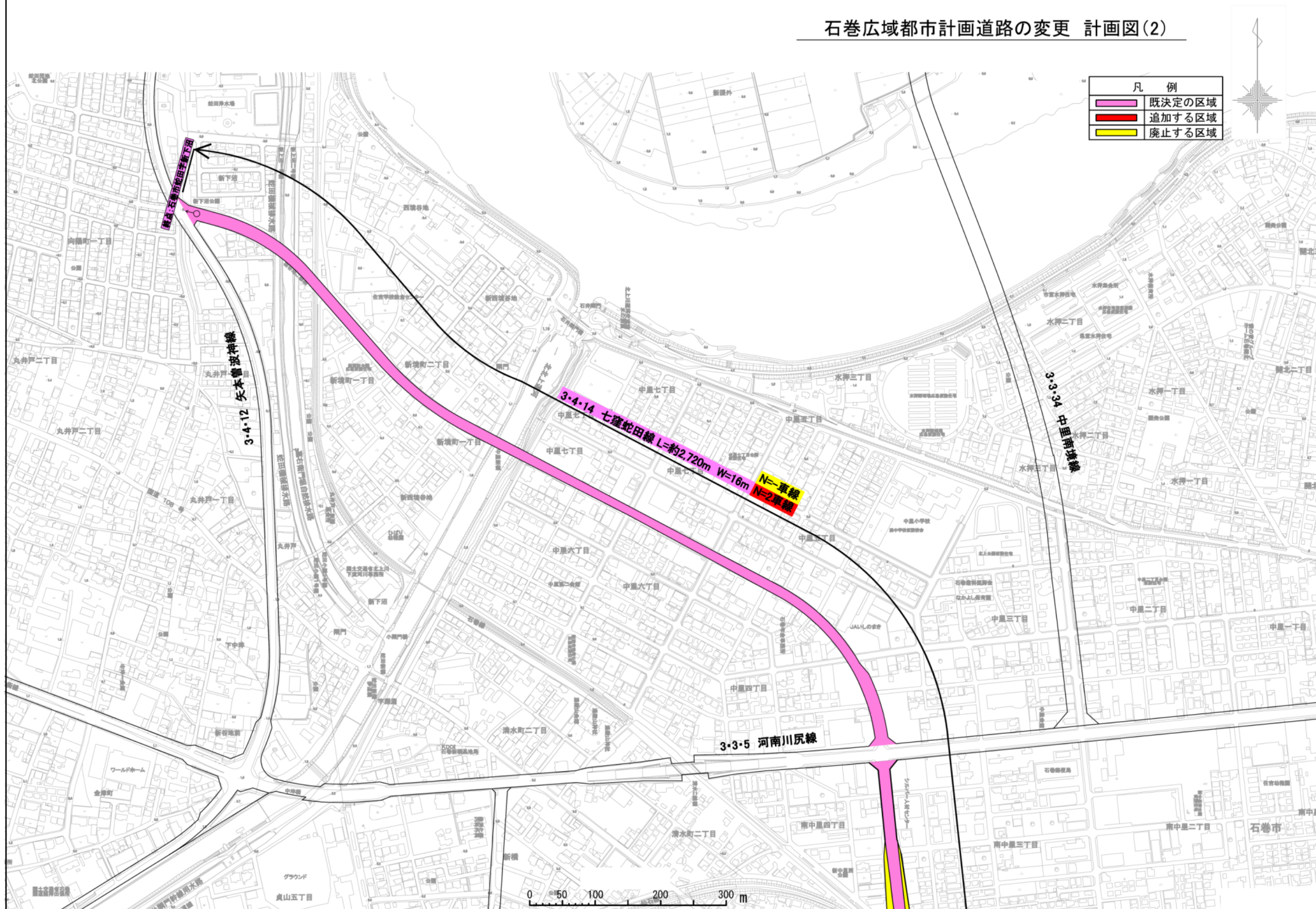
石巻広域都市計画道路の変更 計画図(2)