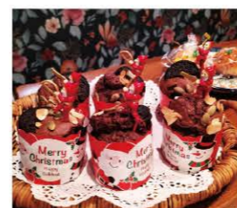
店頭には季節ごとにお菓子が並びます。

私は宮城へ来て知り合いが少なかったのですが、創業準備を始める中でたくさんの方々との出会いや協力を得ることができました。創業塾では一緒に学んだ仲間と現在も交流があり、助けてもらえることに感謝しています。補助金はもちろん、各種申請や経営についても相談に乗ってもらえました。今、私がお店を持つことが出来たのは主人をはじめ、たくさんの方々の好意と協力、ご指導のおかげです。創業することで人の暖かさを感じました。