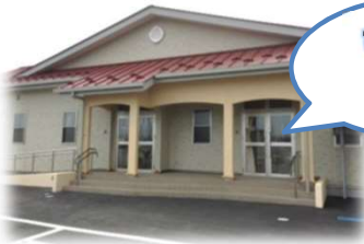
支援センター 入り口

地域で子育てしている方達との虹の架け橋となり、支援センターに足を運んでくださった方が晴れやかな青空のような気持ちになっていただける様取り組んでいます。