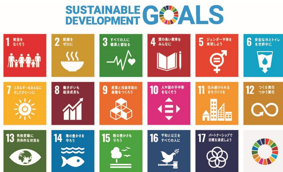
図2-3-1 持続可能な開発目標（SDGs）17の目標

本市は、令和2年7月17日に内閣府から「SDGs 未来都市」並びに「自治体 SDGs モデル事業」に選定されたことを受け、同年8月26日にSDGsの推進を目的とし、「石巻市 SDGs 未来都市計画」（計画期間2020年度から2022年度の3か年計画）を策定した。