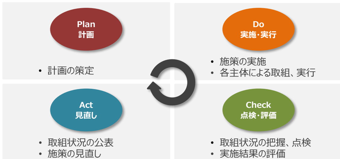
図 4-2 PDCAサイクル

本計画を推進し、効果的な進行管理を行うため、PDCAサイクルに基づいて、取組の継続的な改善と推進を図ります。