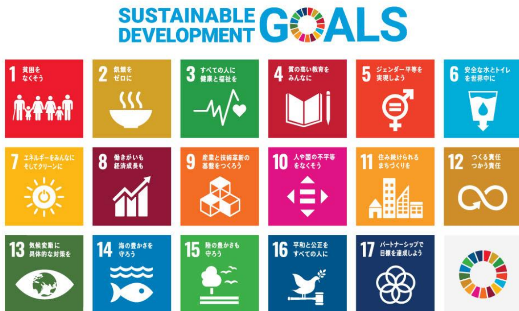
図 1-1 持続可能な開発目標（SDGs）17のゴール

SDGsの理念を取り入れた様々な施策を展開し、誰もが安心して暮らせる持続可能な地域社会の実現を目指すとともに、地域の皆様と力を合わせながら、石巻市のより良い未来を目指して取り組んでいきます。