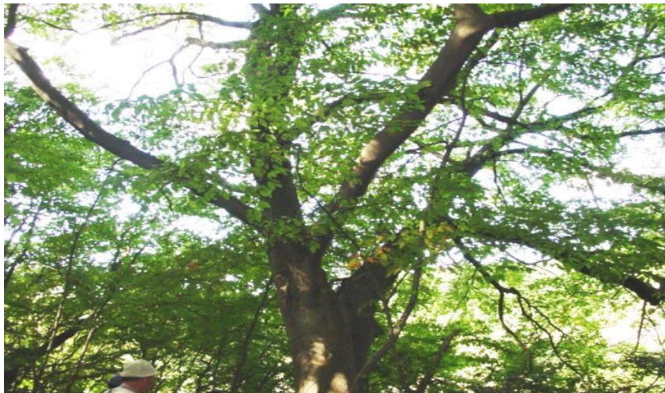
《図4-3 牧山のイヌブナ（牧山市民の森）》

東日本大震災後の復興・復旧事業についても、緑化に配慮をしながら進める必要があります。現在、旧北上川などにおいて緑や水辺に親しめる環境の計画的な整備を進めています。また、避難場所でもある公園などについては、憩いの空間としての充実と利便性を維持するために整備を進めています。