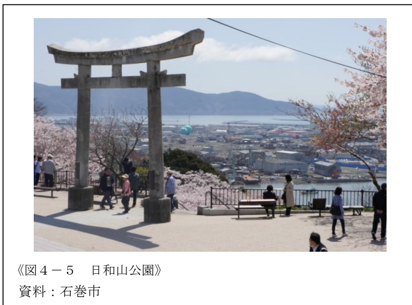
《図4-5 日和山公園》