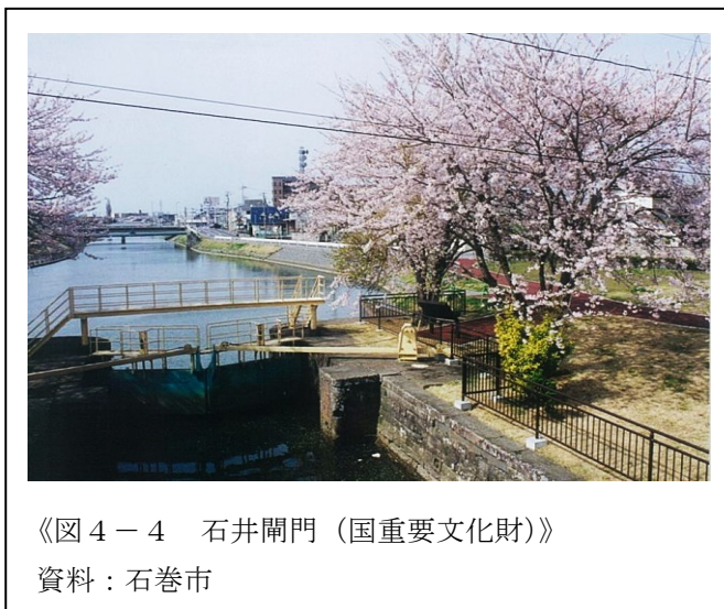
《図4-4 石井閘門（国重要文化財）》

自然と調和した良好な景観は、市民にとってはふるさとの誇りであるとともに心のよりどころであり、来訪者にとっては地域の魅力となることから、今後もこの景観の保全・創出に努めていきます。