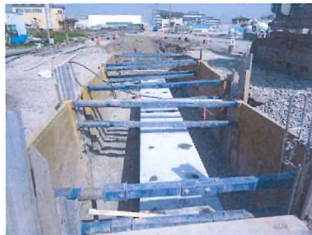
【雨水函渠布設状況】