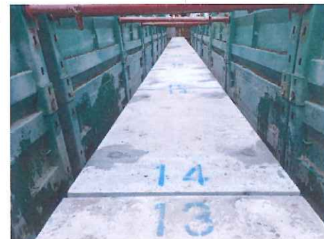
【雨水管渠布設状況】