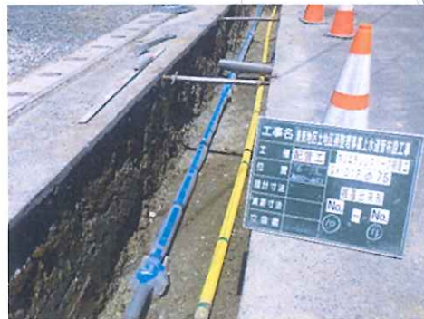
【上水道管布設状況】