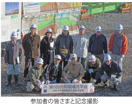
参加者の皆さまと記念撮影

泥を沈殿させ、薬剤等を使用しない環境にやさしい天然ヤシ繊維の泥水ろ過フィルターを通してから排出します。 あわせて地元の方々との密なコミュニケーションを図り、水田や用水路・排水路の水質状況巡視、中干しを実施する落水時期の排水管理等、地元営農に配慮した環境対策を行ってまいります。