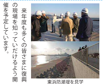
東浜防潮堤を見学

環境配慮 工事排水を過して排出 渡波稲井線の工事区間は、一部営農地帯に属するため、農地環境に配慮した施工を進めます。 施工中の工事排水対策は欠かせません。 具体的には、工事排水を直接工事用地の外に排出しないよう排水タンクや沈砂池等を設け、