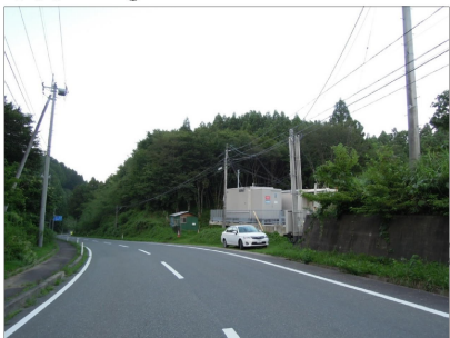
写真 NO. ③