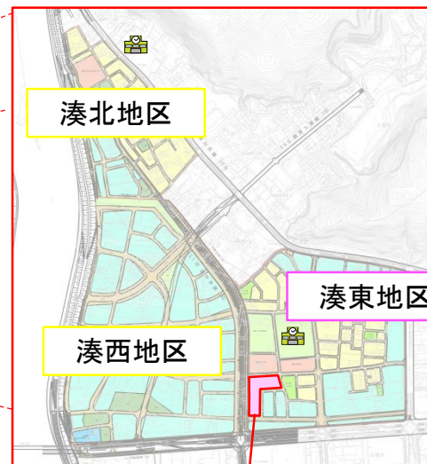
石巻市東学校給食センター開設地