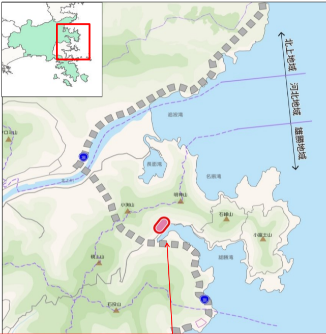
雄勝中心部地区 拠点エリア整備事業位置