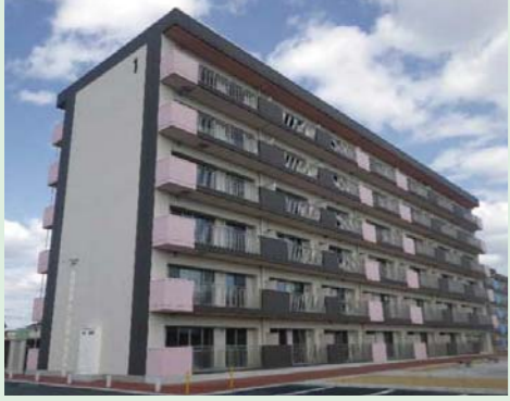
⑬新西前沼第一復興住宅