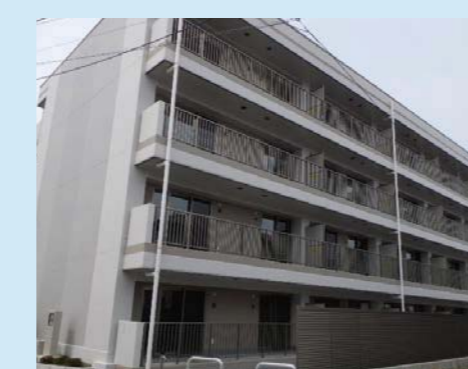
㉞三ツ股第二復興住宅