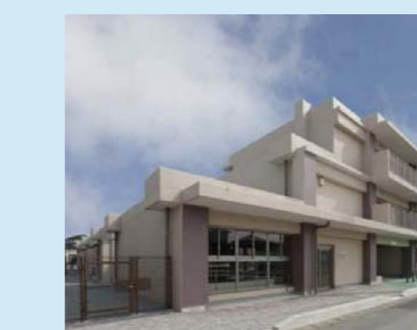
㉘大街道東第三復興住宅