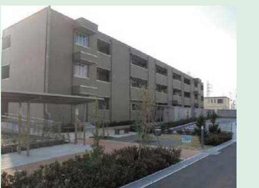
㉑大街道東第二復興住宅