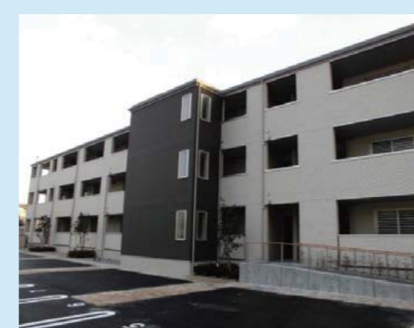
㉕二番谷地復興住宅