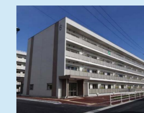
㉟三ツ股第三復興住宅