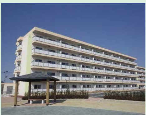
⑮新西前沼第三復興住宅