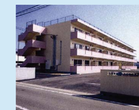
㉗大街道西第二復興住宅