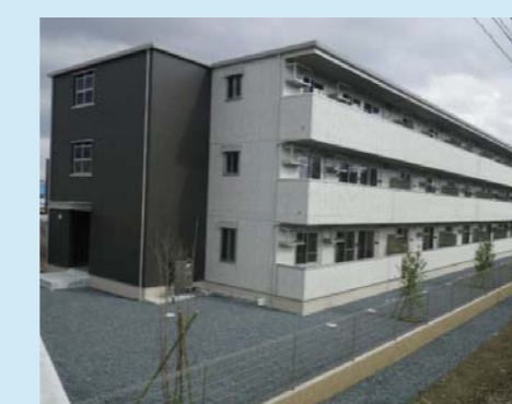
㉖大街道西第一復興住宅