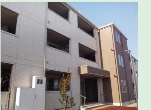
⑲大街道北復興住宅