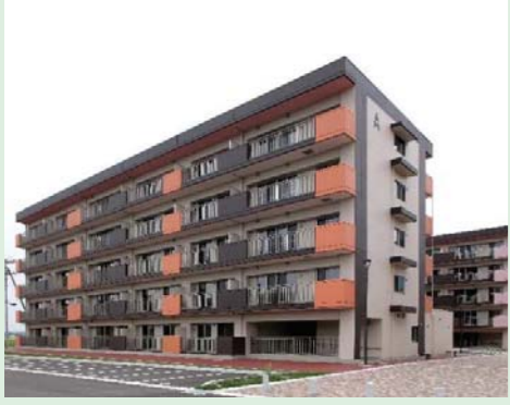
⑫新沼田第二復興住宅