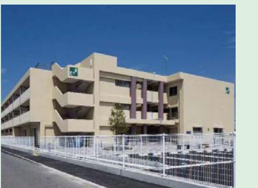
⑳大街道東第一復興住宅