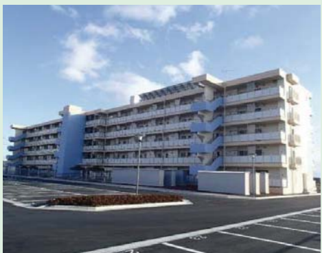
⑭新西前沼第二復興住宅