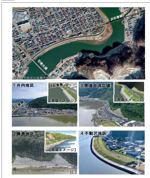
4 河川堤防(石巻大橋～井内地区)