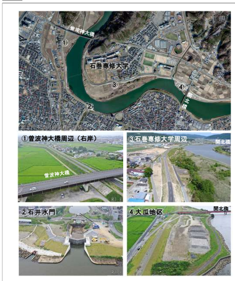
5 河川堤防(大瓜地区～曾波神大橋)