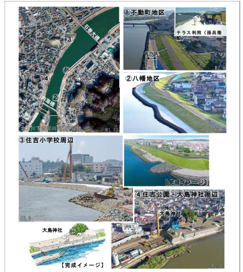
3 河川堤防(内海橋～石巻大橋)