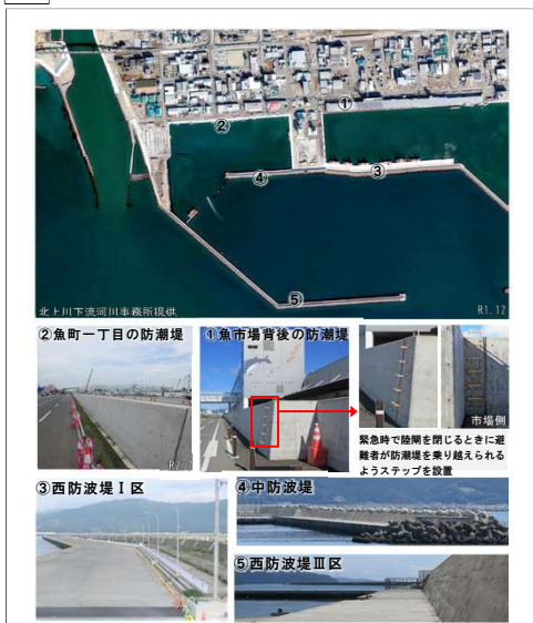
7 防潮堤・防波堤(石巻漁港)