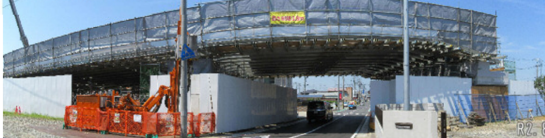
撮影方向D（市道 田道一・蛇田新橋線）