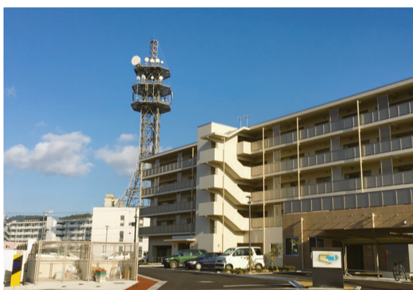
中央公民館前の復興公営住宅

この見学会に参加した市民の皆さんからは、「現場を見ながら説明を聞くと、何をしているかわかりやすい」「工事現場に入ることがないので貴重な体験をした」「工事についての疑問がわかってよかった」「新聞をみて参加した。このような見学会に参加できてよかった」との声が寄せられています。