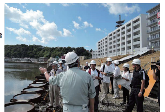
旧北上川右岸promenade整備と築堤工事現場