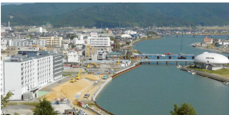
旧北上川右岸promenade・築堤工事現況（H28年10月）

また、当日は多数の報道関係からの取材も行われています。工事調整会議では、工事の進み具合を見ながら引き続き見学会を開催することにしており、第2回合同現場見学会を11月30日に開催します。