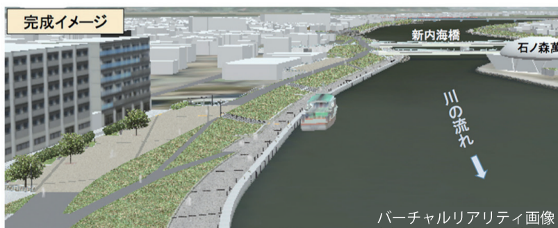
旧北上川右岸promenadeと河川堤防完成イメージ図