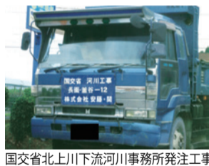
国交省北上川下流河川事務所発注工事