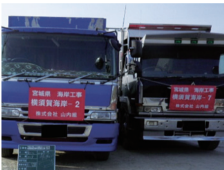
県東部土木事務所発注工事

・工事車両にマスクをつけることにより、市民の皆さんがどんな工事が行われているか確認できます。そのことで、運転手のマナーに対する自覚と意識を高めます。