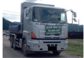
県東部地方振興事務所発注工事