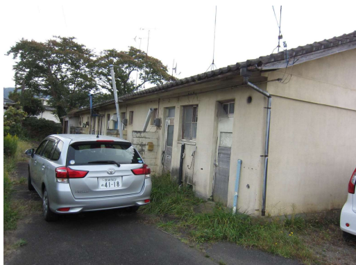
No.2 飯野川本屋敷住宅 3号棟