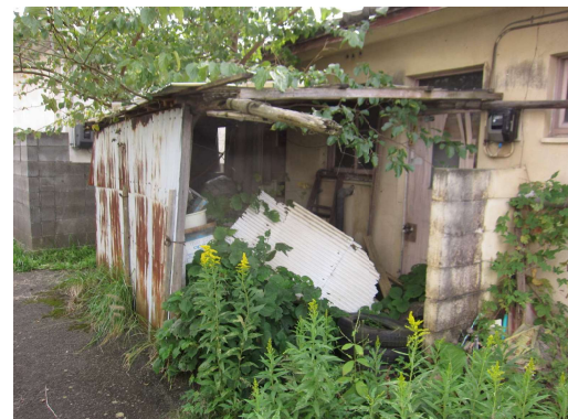
No.4 飯野川本屋敷住宅2号棟 増築部分