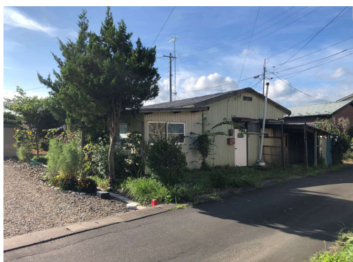
No.3 飯野川本屋敷住宅 4号棟