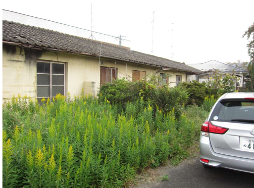
No.1 飯野川本屋敷住宅 2号棟