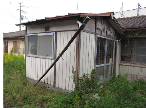
No.5 飯野川本屋敷住宅2号棟 増築部分