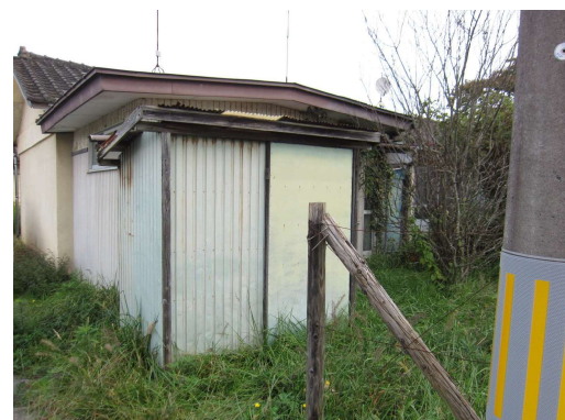
No.6 飯野川本屋敷住宅3号棟 増築部分