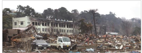
<2011年（平成23年）3月31日撮影>