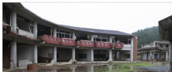
<2015年（平成27年）9月10日撮影>

●このことから、旧大川小学校校舎は、震災伝承のための防災教育や慰霊・追悼を行う重要な場所です。