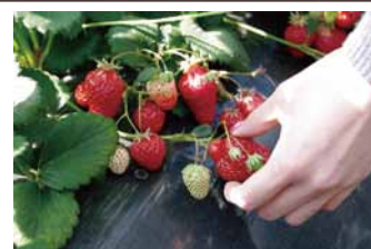
イチゴの摘み取りで農業プチ体験

地元食材を使ったランチ・交流会 = 石巻駅 (男性解散) = 仙台駅着 (女性解散) (11:30) (13:30) (15:00)