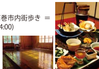
温泉と美味しい料理を堪能♪

追分温泉にて交流親睦会 = (男性：懇親会後解散 (石巻駅までバス移動) (20:10=21:00 石巻駅着) ) (18:00～20:00) (女性：婚活のプロ講師に恋愛相談=宿泊 (相部屋となります))