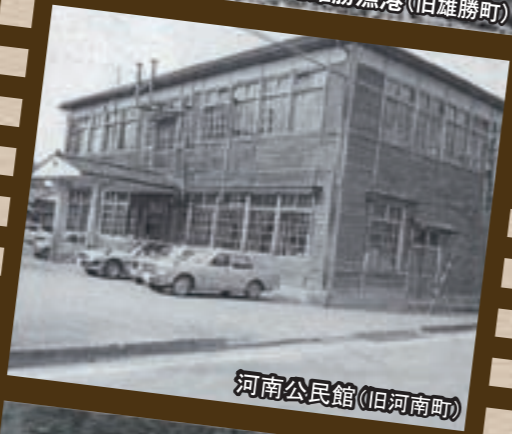
河南公民館(旧河南町)