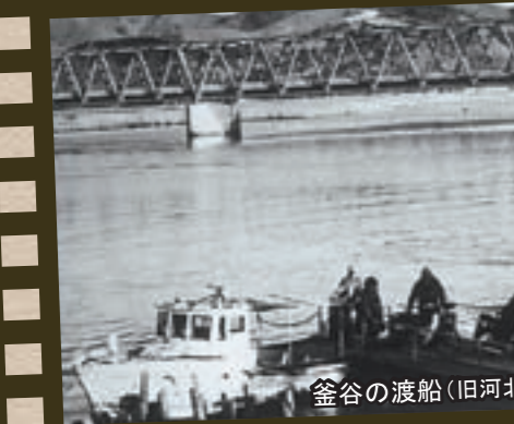
釜谷の渡船(旧河北町)