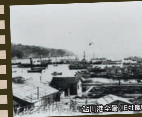
鮎川港全景(旧牡鹿町)