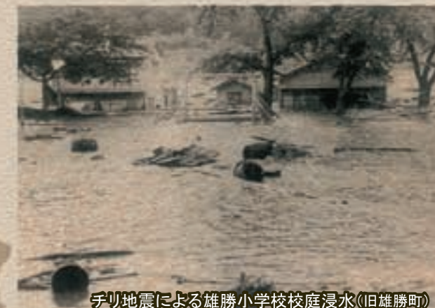
チリ地震による雄勝小学校校庭浸水(旧雄勝町)