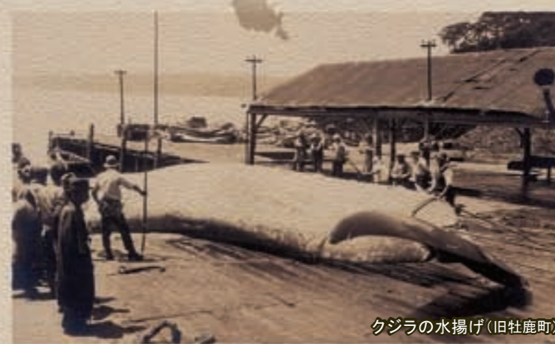
クジラの水揚げ(旧牡鹿町)