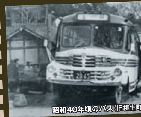
昭和40年頃のバス(旧桃生町)