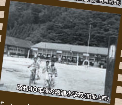
昭和40年頃の橋浦小学校(旧北上町)