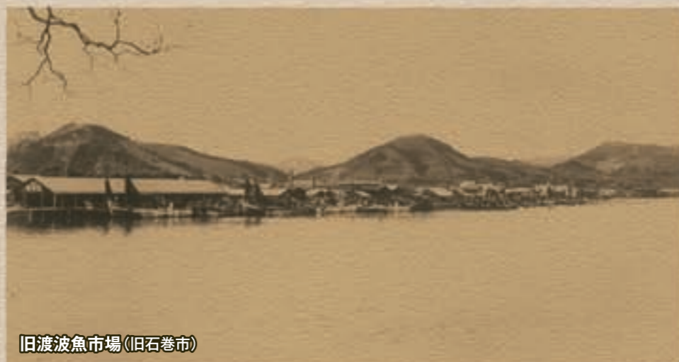
旧渡波魚市場(旧石巻市)