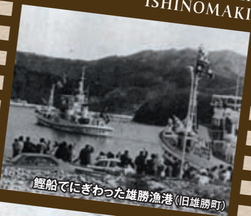
鯉船でにぎわった雄勝漁港(旧雄勝町)