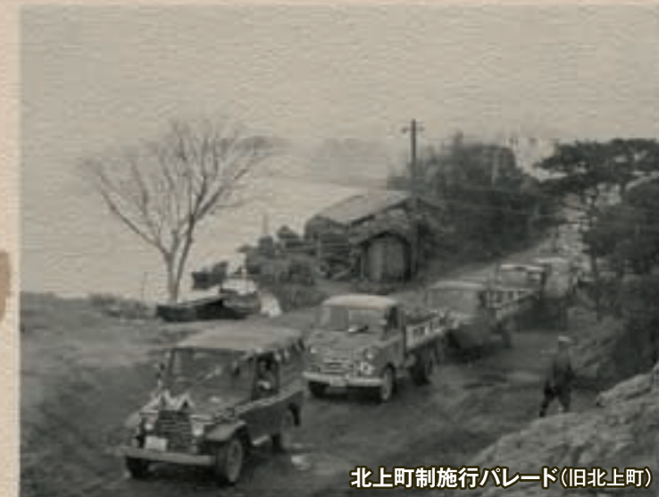
北上町制施行パレード(旧北上町)