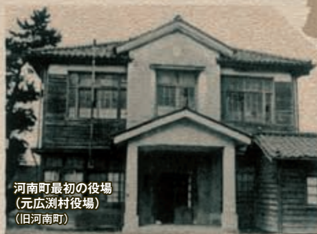
河南町最初の役場 (元広瀬村役場) (旧河南町)