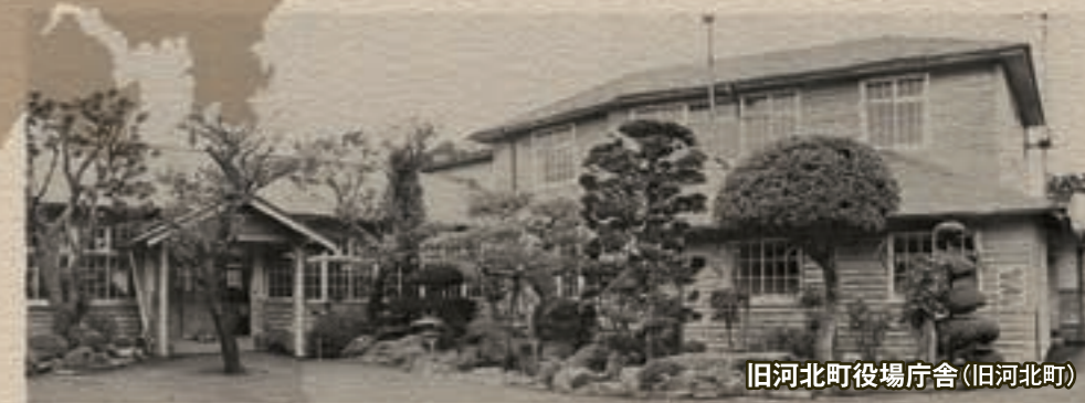
旧河北町役場庁舎(旧河北町)