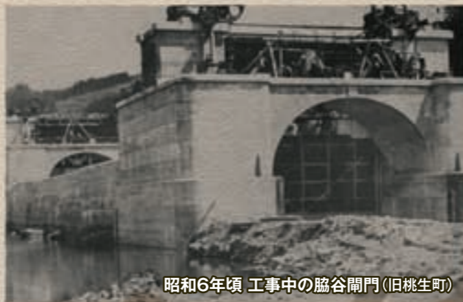
昭和6年頃 工事中の脇谷閘門(旧桃生町)