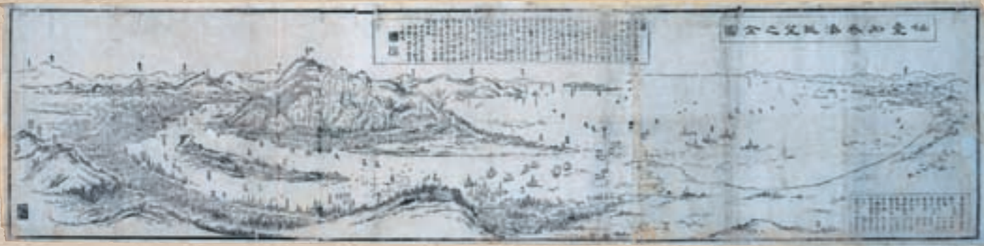
仙台石巻湊眺望全図

江戸時代の石巻は、港町として繁栄した現在の中心市街地、大規模な新田開発が行われ、豊かな米作地帯であった平野部、漁業が盛んで、遠隔地交易も営んでいた沿岸部の三つの地域で構成され、現在の石巻地域の基礎ができあがりました。