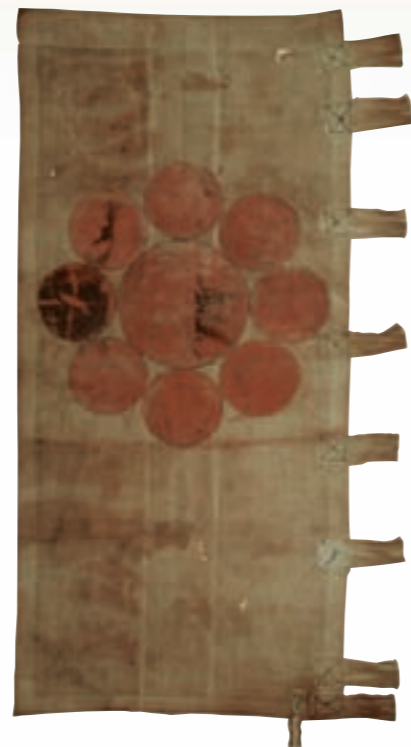
仙台藩御用船ののぼり

仙台藩御用船は、伊達氏の印の一つである九曜ののぼりを掲げていた。船尾に赤九曜ののぼりが描いてある。