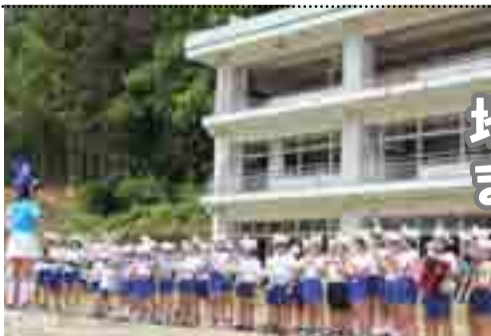
被災校舎前で演奏する相川小学校の児童

7月の「社会を明るくする運動」強化月間に合わせ、北上地区の橋浦、相川、吉浜の3つの小学校の児童たちが鼓笛隊パレードや福祉施設の慰問等を行い、地域を元気付けました。