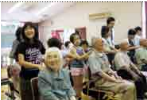
お年寄りとふれあう吉浜小学校の児童たち