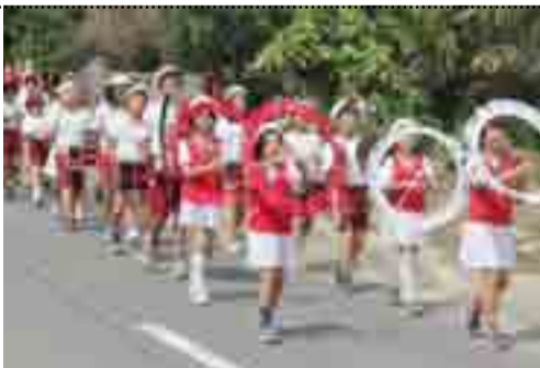
地域をパレードした橋浦小学校の鼓笛隊