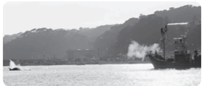
捕鯨船による実砲捕鯨ショー