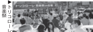
トトリコローレ音楽祭