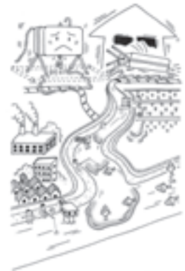
油の流出は広範囲に影響を及ぼします!

川の水は水道用水や工業用水、農業用水に使われています。また、川は魚類など多様な生物の生息の場にもなっています。私たちの暮らしと豊かな自然を守るためにも十分な注意をお願いします。