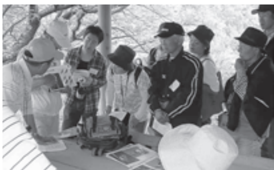
▶ 昨年の講座の様子

平成22年度のリーダー育成講座でたくさんの方々に体感していただきたいと思います。