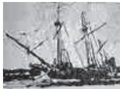
主催/お絵描き教室ゴッコン (門脇・渡波・あけぼの)