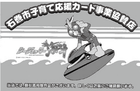
▲協賛店 オリジナルシール