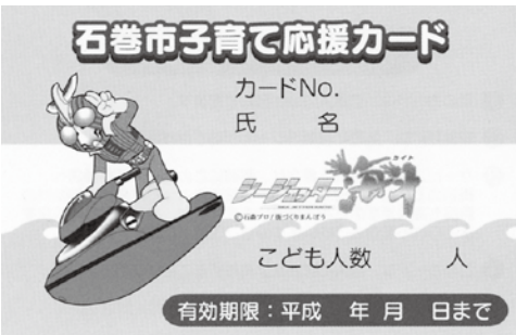
▲子育て応援カード

この事業は、18歳未満の子どもを3人以上養育する保護者にカードを交付し、事業の協賛店から割引サービスを提供することにより、子育て中の家庭の経済負担を少しでも軽減しようとするものです。