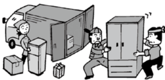
図 廃棄物対策課(内線402・403)

※処理方法および収集運搬許可業者については、直接問い合わせいただくか、市のホームページで確認してください。