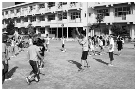
タイミング良くジャンプ!(児童集会での長縄跳び)

また、環境面の利点を生かし、隣接する中学校・高校からそれぞれ、鼓笛隊への演奏指導や、本の読み聞かせをしてもうつなど学校間の交流も盛んです。