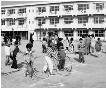
たがまわしの様子(貞山まつりより)

貞山小学校では、「毎日学び、心豊かで、たくましく生きる子ども」の育成(子ども達には分かりやすく、「じゅんじゅん」と笑顔と思ったり、「びびび」と元気な声を出したり)「何かで人よりがんばろう」と話しています(を)を目指し、さまざまな工夫を凝らした取り組みを行っています。中でも「楽しい」「分かる」「力の付く」授業をテーマにした「できたこと発表会」は、学年ごとに四字熟語の暗記やけん玉など遊び感覚も取り入れた課題に取り組み、その成果を授業参観日に発表するもので、子ども達一人ひとりのやる気と意欲を向上させ、やり遂げた後の充実感や達成感を実感も味わってもらうのがねらいです。ほかにも、学