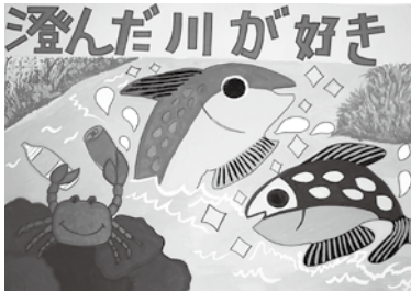
▲ 石巻市長賞 ポスター部門 阿部圭織さんの作品