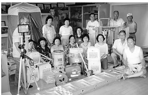
▲小竹浜自主防災会の皆さん