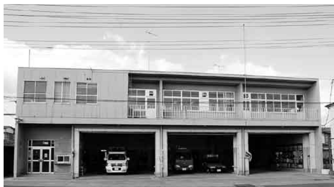
▲ 解体し新築する石巻消防署南分署