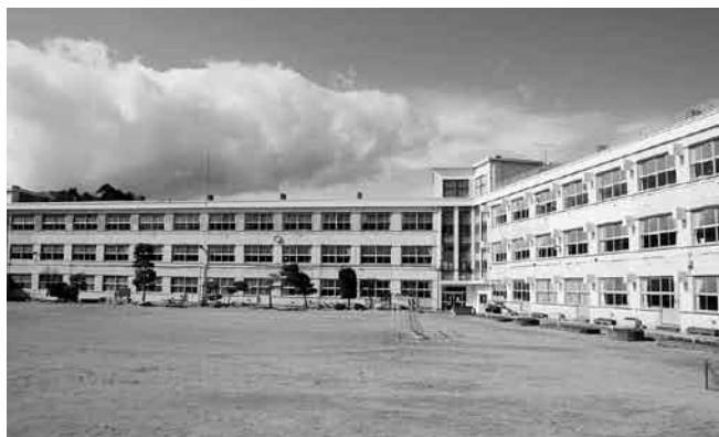
▲ 耐震補強事業を行う石巻小学校