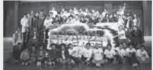
▲昨年度の実行委員の皆さん

管内の青年達が企画した老若男女問わず、楽しめる文化祭 です。夜な夜な会議を重ねて、さまざまな工夫を凝らしまし た。ぜひ、ご来場ください。