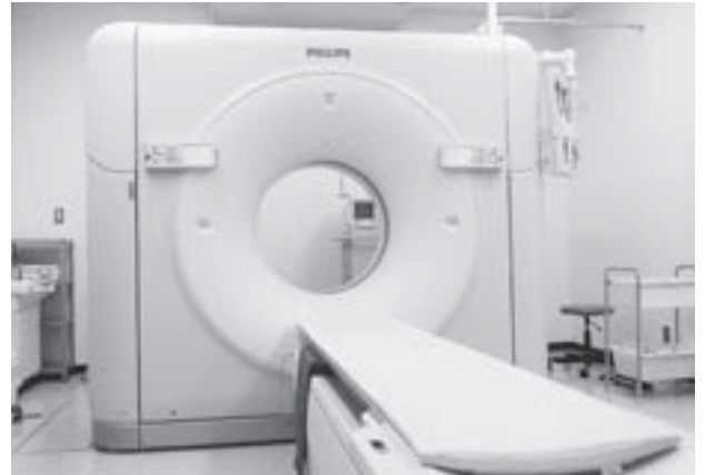
▲1月から本格稼働している全身用超高速マルチスライスCT装置