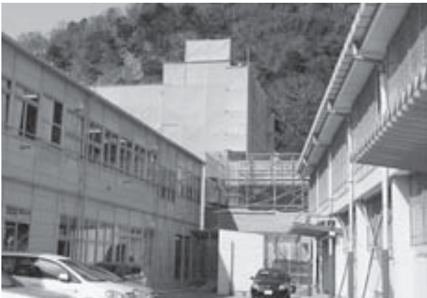
▲大規模改造工事が進む湊小学校