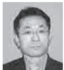
市立病院 医療福祉相談室