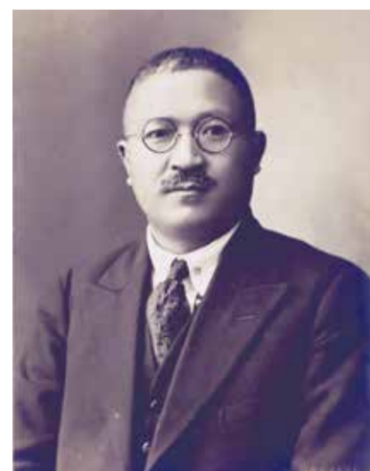
▲布施辰治肖像写真