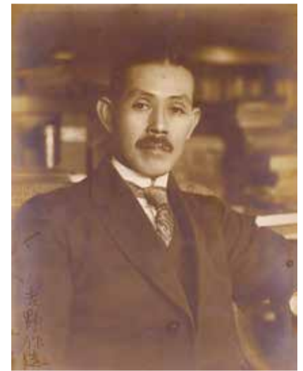
◀吉野作造肖像写真