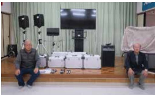
図 地域協働課(内線3315)・各総合支所地域振興課

整備内容 物置、液晶モニタースタンド、モニター用テレビ、カラオケDVDプレイヤーセットなど