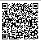
図 健康推進課(内線2427)、各総合支所市民福祉課

インフルエンザ・新型コロナウイルス感染症定期予防接種の期限は1月31日(土)です。予防接種を受けていない方は、早めに受けましょう。詳しくは市ホームページを確認ください。