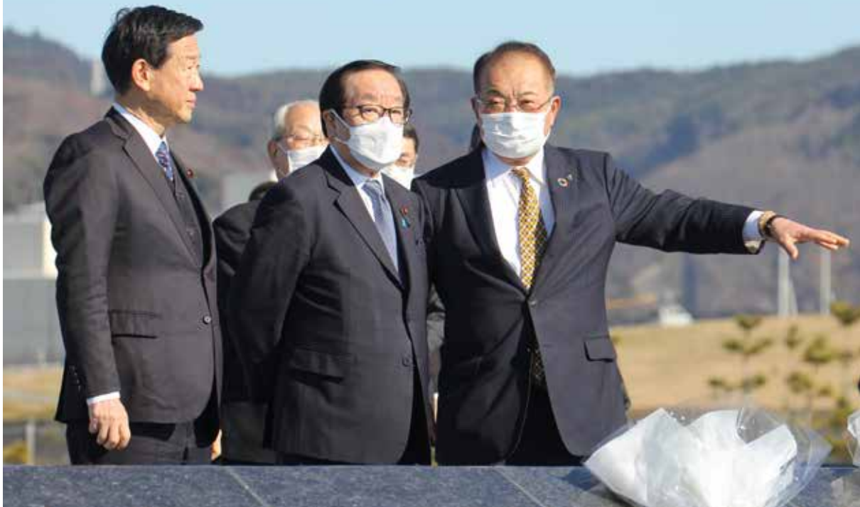
まちの復興状況について説明を受ける 渡辺復興大臣(中央)