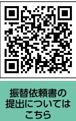
振替依頼書の提出についてはこちら