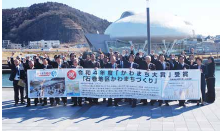
図 河川港湾高規格道路整備推進課(内線5608)

今後の活用策について、石巻専修大生が竹灯籠や果実袋を使ったイルミネーション、縁日企画、まち歩きなど水辺空間を使った地域活性化策を発表しました。