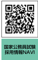
国家公務員試験採用情報NAVI