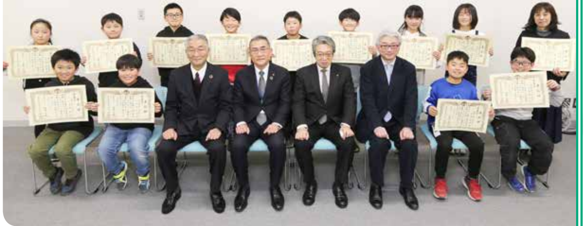
図 学校安全推進課(内線5084)

最高賞の市長賞には、鮎川小の3～4年生5人がまとめた防災マップが選ばれ、審査員からは「少ない人数ながら、地域のことがよくまとめられていました。インタビューをしたことで、地域の皆さんの顔までイメージできるような作りになっており、主体性も見られます」などと講評がありました。