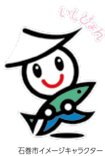
石巻市イメージキャラクター

震災から12年を迎えるに当たり、震災の犠牲となられた方々に対し哀悼の意を捧げるため、追悼式を挙ります。3月11日(土)に石巻市慰霊碑において、ご遺族代表者および来賓の皆さまをお招きし、追悼式典を挙りますので、ご遺族の皆さまをはじめ、献花を予定している方は、式典開始前または終了後に献花をお願いします。なお、式典中は、会場内に別に設置する献花台にて献花をお願いします。