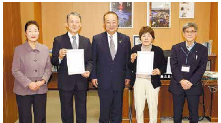
民生委員協力員委嘱状交付式

市は今年度から、「民生委員協力員制度」を導入し、1月17日に2名の方に委嘱状を交付しました。