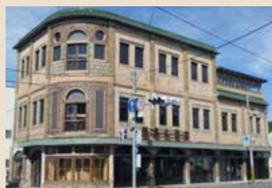
平成27年に市指定文化財に指定された