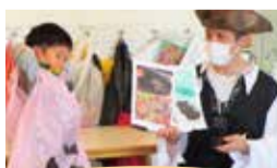
ハロウィン&英語学習