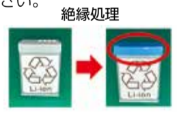
廃棄物対策課(内線3374)