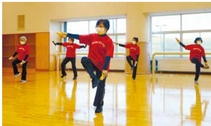
多彩な動きで全身の筋肉を刺激します

ラジオ体操で体をほぐしてから軽いレクリエーションでウォーミングアップ。そこから12種類の基本動作がある