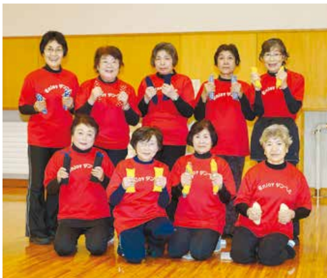
エンジョイダンベルかほくの皆さん

楽しく、明るく健康寿命を延ばそう。毎月第2、4火曜日の午後に活動するエンジョイダンベルかほくの皆さんは、河北総合センタービッグバンで活動しています。玄米ダンベルを使った健康体操で、筋力維持や基礎代謝の向上を目指しています。エンジョイダンベルかほくは、平成18年に設立されました。その頃は他の地域でも玄米ダンベルを取り入れた体操が広がりを見せ、河北地区でも地域の健康づくりとして始まりました。震災により会員は一時減少しましたが