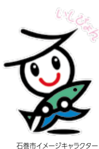
石巻市イメージキャラクター