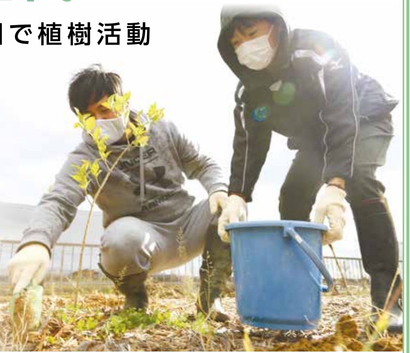
図 都市計画課(内線5615)

11月3日には今年で4回目になる「石巻復興の森づくり植樹祭」が、公園南側の雲雀野松原で行われました。コロナ禍のため今年は関係者のみで実施されました。植えたのはクロマツやカシワなど16種約3千本で、苗木はイオン環境財団の寄付です。公園で活動する市民団体の参加型運営協議会やイオン関係、国・県・市職員など約200人が参加し、密を避けて2回に分けて作業に汗を流しました。