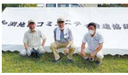
和渕地区コミュニティ推進協議会

助成団体名 和渕地区コミュニティ推進協議会 整備内容 集会用テント、発電機、給湯器、掃除機