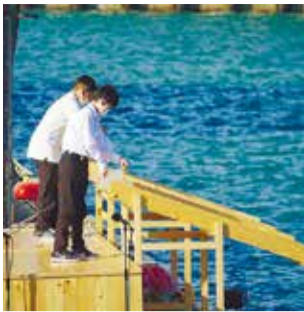
▼ホシガレイとヒラメの稚魚を放流