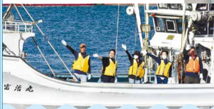
▼底びき網船や養殖船など9隻が漁港内をパレードしました