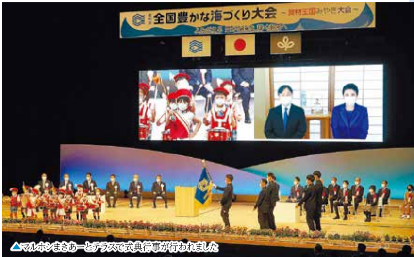
▲マルホンまきあーとテラスで式典行事が行われました

事では、未来の海づくりに向けたメッセージが朗読され、石巻漁港で行われた海上歓迎・放流行事では漁船7隻と官公庁船2隻の計9隻が港内をパレードしたほか、ホシガレイ、ヒラメの稚魚計800匹が放流されました。天皇皇后両陛下もオンラインでご臨席され、行事終了後は東日本震災の被災者と画面越しに懇談さ