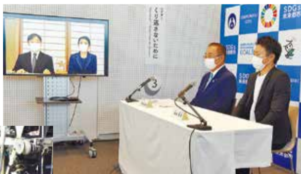
▲東日本大震災津波伝承館で両陛下と懇談しました