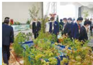
▲魚市場の展示ブースでは海に豊かな水を届ける山や森林の大切さを伝えました