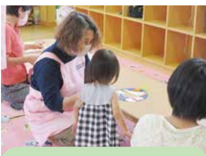
自分の手形、足形で七夕飾りを作りました。(なかよし保育所地域子育て支援センター)

民生委員・児童委員の中には、特に児童に関することを専門に担当する「主任児童委員」がいます。活動の一つである「子育てふれあいサロン」では、子育て支援センターにて、季節の行事や遊びなどを通して親子とのふれあいや、子育て相談などを行っています。