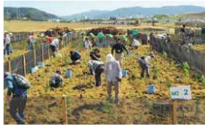
前回(令和元年)の様子