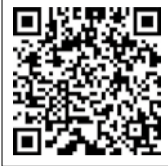
参加申込フォーム

申込方法 参加者の氏名、住所、年齢、電話番号およびメールアドレスを記入の上、FAXまたは申込フォームにより申し込みください。