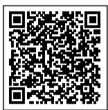
総務省統計局ホームページ

調査対象は無作為に抽出します。対象の家庭に、9月以降、調査員が訪問します。回答をお願いします(調査員は知事が任命し、「調査員証」を携帯しています)。