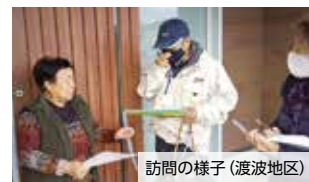
訪問の様子(渡波地区)

民生委員・児童委員は地域の身近な相談相手として、地域の皆さんの相談に乗ったり、見守り活動を行っています。皆さんから困り事や心配事を聞き、支援が必要な人と行政・専門機関などとの「つなぎ役」とし、地域に密着した活動を行っています。