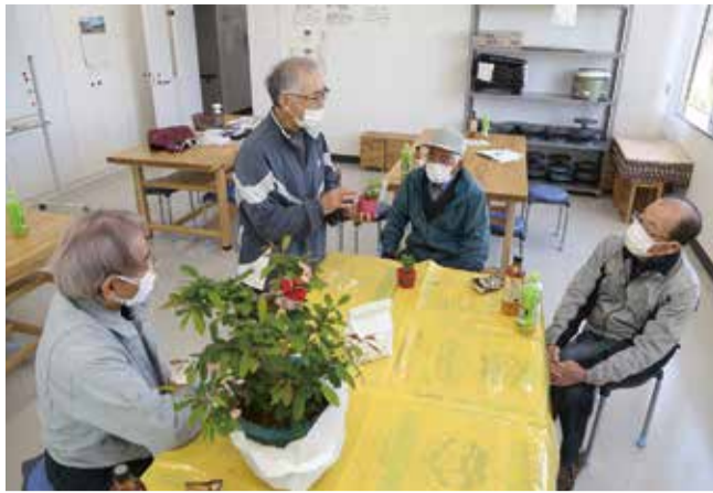
ゆったりとした時間の中で自慢の盆栽を披露し合いながら魅力を語り合う皆さん