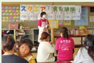
子育て支援センターでの講話の様子

「食生活改善推進員(通称:ヘルスメイト)」とは、「私たちの健康は私たちの手で」をスローガンに、食を通じて地域の健康づくりを推進するボランティア団体で、全国各地に設置されています。市では、7分会171人の食生活改善推進員が活躍しています。自分や家族の健康管理を行うことはもとより、お隣さん、お向かいさん、さらに地域などで栄養講習会を開催するなど地域に根ざした活動をしています。