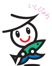
石巻市イメージキャラクター

市が整備を進める都市計画道路「釜大街道線」のうち、中浦二丁目の石巻工業港曾波神線との交差点(延長148㍍)が10月2日に開通しました。開通式ではテープカットとくす玉割りを行い、国道398号の混雑を緩和し、災害時には避難路の役目も果たすように期待を寄せました。釜大街道線は県道石巻港インター線と県道石巻女川線を結び総延長約3.6㍍。曾波神線との交差点の完成で、国の復興交付金を活用した中屋敷一丁目から大街道南二丁目までの約1.8㍍が途切れなく通行できるようになりました。