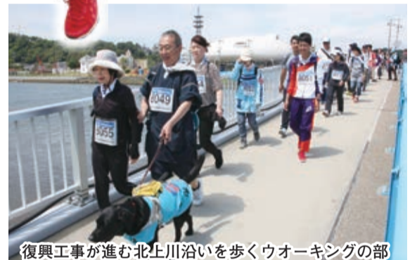
復興工事が進む北上川沿いを歩くウォーキングの部