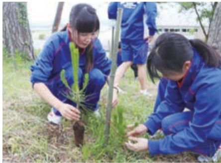
公民館分館対抗球技大会

松くい虫被害で減少が進む松林を再生しようと、住民団体「ものう夢ネットワーク」と桃生公民館は7月7日、桃生植立山公園にアカマツの苗木750本を植樹しました。地域住民や桃生中生徒ら約90人が参加。石巻地区森林組合から指導を受けながら高さ30センチほどのアカマツの苗木を丁寧に植えました。植立山公園での植樹活動は4回目で、毎年800本近くを植えています。