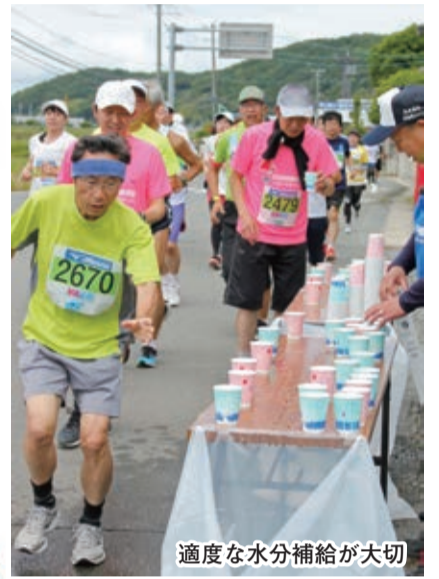
適度な水分補給が大切