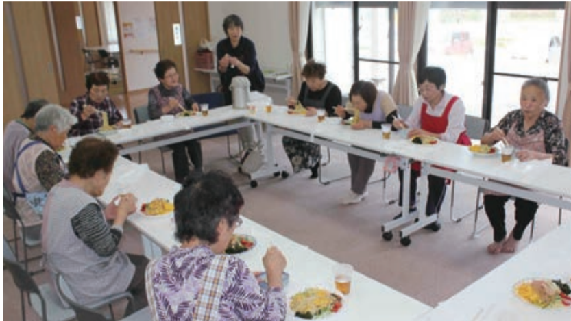
手作りの昼食を味わいながら談笑