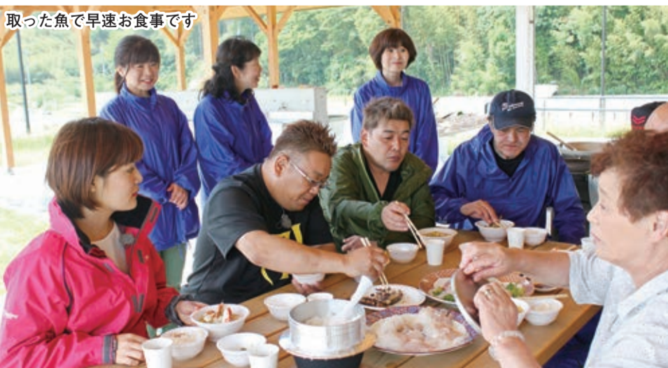
取った魚で早速お食事です