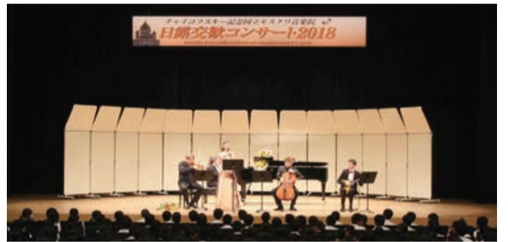
昨年のコンサートの様子

とき 9月28日(土) 午後2時開演(午後1時開場) ところ 遊楽館 演奏曲 エルガー「愛の挨拶」、チャイコフスキー「くるみ割り人形行進曲」など 定員 400人[先着] ※未就学児童の入場はできません。 申込方法 往復はがきに必要事項を記入し、申し込みください。「返信表面」代表者の郵便番号・住所・氏名記入。「往信用裏面」代表者の郵便番号・住所・氏名・年齢・電話番号・同伴者(3人まで)の氏名を記入。 ※返信用の裏面は何も記入しないでください。 ※返信はがきは入場券になりますので、当日必ず持参してください。 ※車椅子利用の方は、その旨はがきに記入してください。 申込期限 9月17日(火) ※当日消印有効