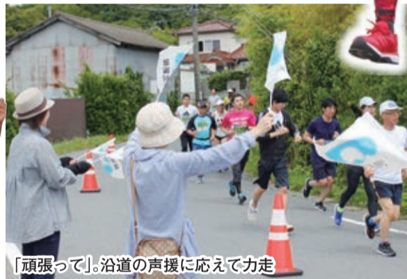
「頑張っ」沿道の声援に応じて力走