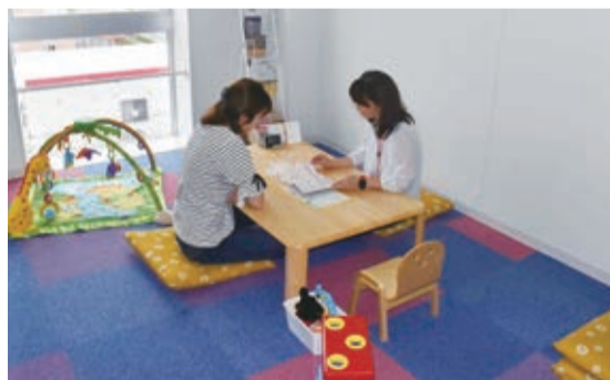
ローテーブルを置き、家庭的な雰囲気の個別相談室

☎・園 石巻市子育て世代包括支援センター「いっしょ issyo」 ☎24-6878 (のぞみ野二丁目2-4 石巻信用金庫総合相談センター4階)