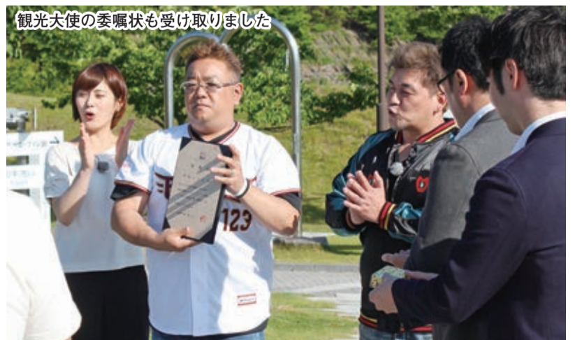
観光大使の委嘱状も受け取りました