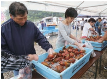
白浜ビーチパークデイ

「第7回牡鹿半島はまっこ市」が7月6日、鮎川浜の牡鹿公民館跡地で開かれました。地元で水揚げされた殻付きホヤを約1トンの用意。詰め放題では1袋500円で提供し、参加者は大きなホヤを袋に入れ、笑顔を見せていました。定置網で取れたサバとアジの詰め合わせは整理券を配布して約150ケースを販売し、海産物や鯨肉、野菜、加工品などの出店も並び、にぎわいました。