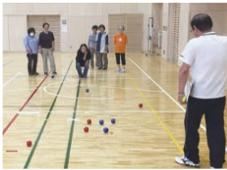
石巻復興支援ネットワークが受賞

女性教室「こぶし塾」が6月20日、雄勝小・中学校体育館で開かれました。今回は14人が参加し、ニュースポーツである「ペタンク」を行いました。ほとんどの方が未経験でしたが、参加者は楽しみながらも、時には真剣に練習や試合に取り組みました。お互いに声を掛け合いながら和気あいあいとプレーする姿も見られました。参加者からは「けっこう良い運動になった」、「機会があればまたやりたい」などの声が聞かれました。