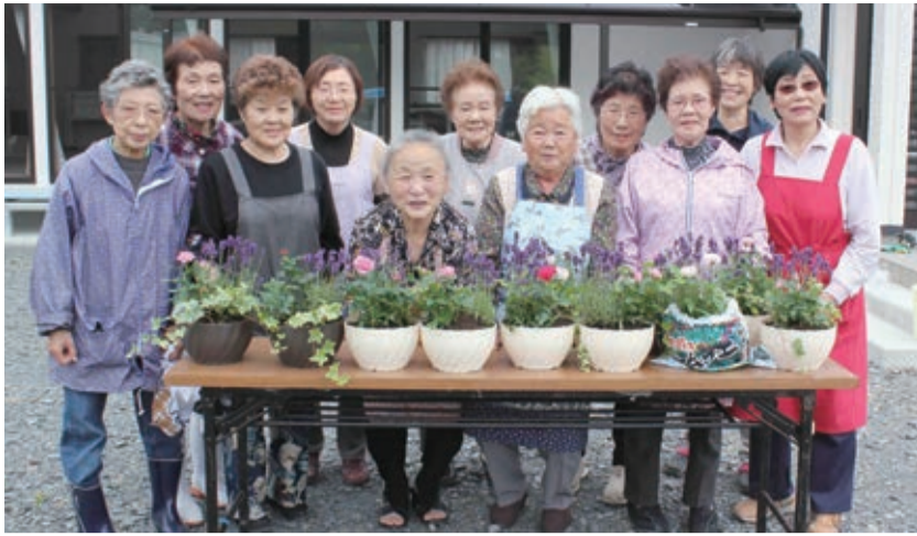
心を込めて仕上げた花の寄せ植え

本年度3回目の6月18日は70〜80歳の女性12人が参加。活動拠点にしている「くぐり会館」周辺の除草作業をした後、ミニバラ、ラベンダー、ツタ類を直径20センチ、高さ10センチほどの丸いプランターに寄せ植えする活動に取り組みました。完成した寄せ植えは各自で持ち帰り、牡鹿地区内の公共施設、病院などにも届けまし