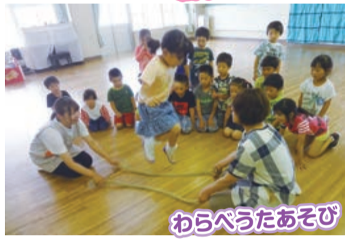
わらべうたあそび