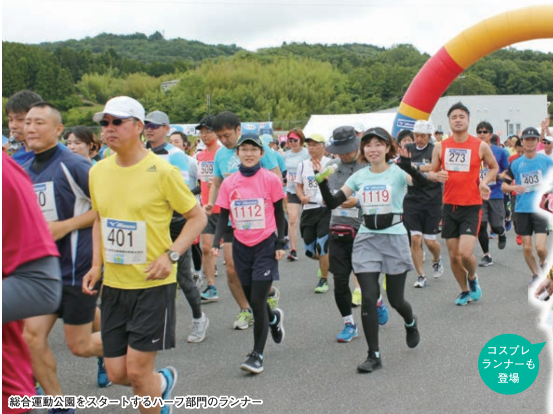
総合運動公園をスタートするハーフ部門のランナー

第5回いしのまき復興マラソンが6月23日、市総合運動公園を発着点に行われました。ハーフ、10キロなど32部門に2010人が参加し、沿道の声援に励まされながら稲井地区を巡るコースに挑みました。仮設住宅が減り、前回東京五輪の聖火台も返還されたとはいえ、復興は道半ば。選手たちは「震災を忘れてはいけない」「頑張れ、石巻」とエールを送り、心地良い汗を流しました。前日の22日は復旧が進む北上川河口エリアでウォーキングの部がありました。