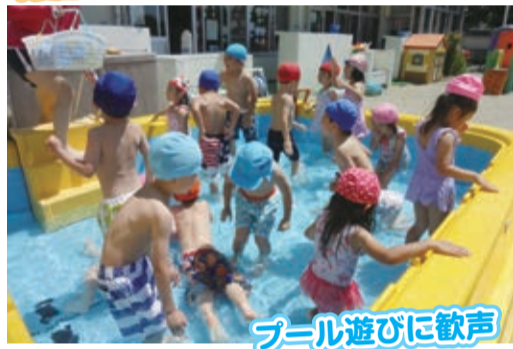
プール遊びに歓声