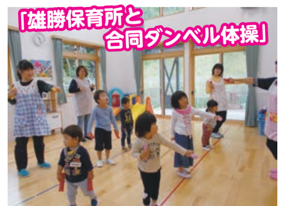
「雄勝保育所と合同ダンベル体操」