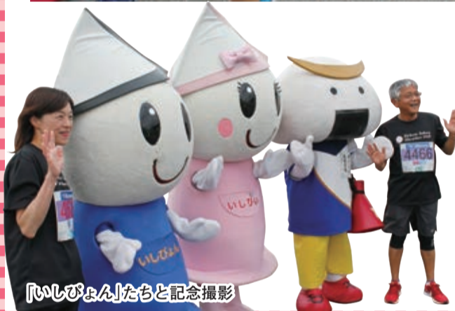
「いしびよん」たちと記念撮影